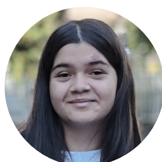
NELLY OLÁHOVÁ hlavní fotografka